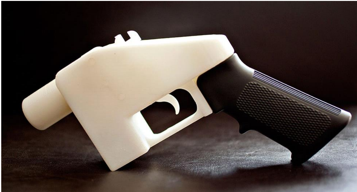
Liberator, 3D vytlačená zbraň kalibru .22.