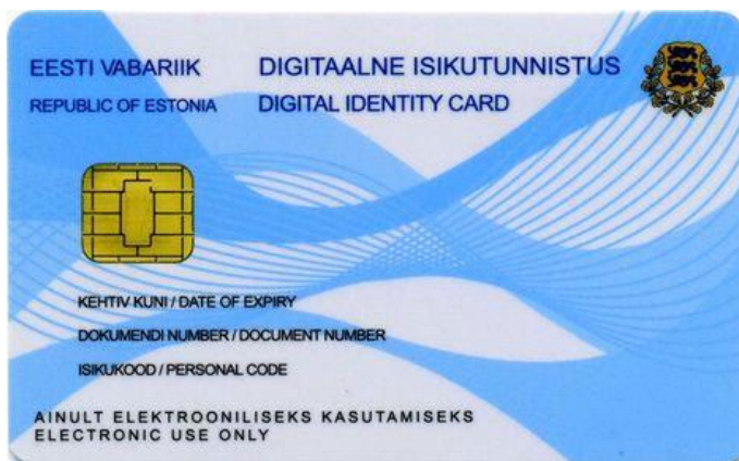
Digitálna identifikačná karta Estónska

Estónsko je dlhodobo lídrom v digitalizácii štátnej správy a inováciách v tejto oblasti. Komplexný portál štátnych služieb bol sprístupnený občanom v roku 2005. Prostredníctvom neho sa minimalizoval počet úradníkov a návštev občanov na úradoch. Estónsko inovácie v tejto oblasti dynamicky rozvíja naďalej a ako prvá krajina sprístupnila koncept digitálneho obyvateľa E-residency už koncom roka 2014. Občania Európskej únie majú možnosť zažiadať o digitálne podpísanú rezidenčnú kartu, cez ktorú môžu komunikovať s úradmi v Estónsku, zakladať spoločnosti alebo bankové účty. Tým sa začína vytrácať priamy vzťah pravidiel a jurisdikcie na fyzický priestor, kde sa práve osoby nachádzajú.