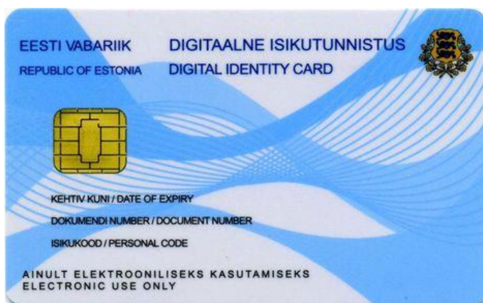
Digitálna identifikačná karta Estónska

Estónsko je dlhodobo lídrom v digitalizácii štátnej správy a inováciách v tejto oblasti. Komplexný portál štátnych služieb bol sprístupnený občanom v roku 2005. Prostredníctvom neho sa minimalizoval počet úradníkov a návštev občanov na úradoch. Estónsko inovácie v tejto oblasti dynamicky rozvíja naďalej a ako prvá krajina sprístupnila koncept digitálneho obyvateľa E-residency už koncom roka 2014. Občania Európskej únie majú možnosť zažiadať o digitálne podpísanú rezidenčnú kartu, cez ktorú môžu komunikovať s úradmi v Estónsku, zakladať spoločnosti alebo bankové účty. Tým sa začína vytrácať priamy vzťah pravidiel a jurisdikcie na fyzický priestor, kde sa práve osoby nachádzajú.