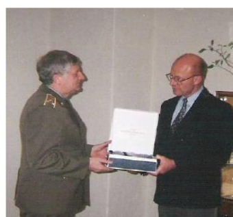
Návšteva riaditeľa DEFENSE INTELLIGENCE AGENCY (USA) v Žiline (1993)